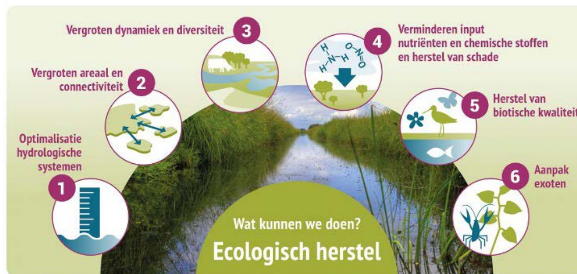
Figuur: aanknopingspunten voor ecologisch herstel volgens kennisnetwerk OBN